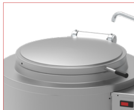
Coperchio bilanciato e maniglia atermica | Balanced lid and heat resistant handle