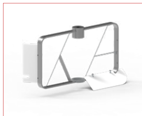
Miselatore | Mixer