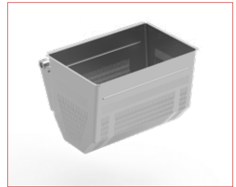
Cesta | Basket