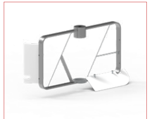
Mixer | Mixer