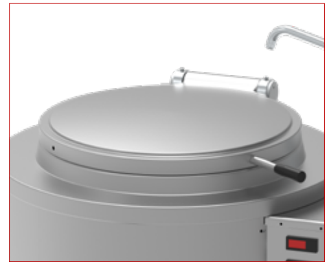
Tapa equilibrada y asa atérmica | Balanced lid and heat resistant handle